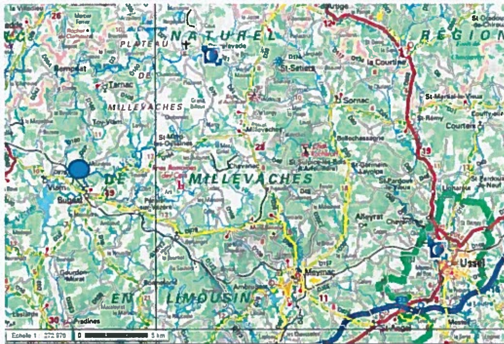
Plan de situation (extrait de l'étude d'impact)

La localisation du projet est présentée ci-après :