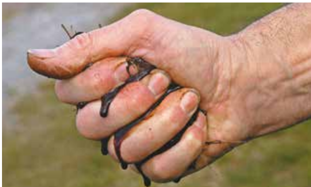
Le compost doit être humide (comme une éponge pressée) mais sans excès. Si du liquide sort d'une poignée de compost pressée, il est trop humide.

Trop d'humidité empêche l'aération : le compostage est freiné et des odeurs désagréables se dégagent. Si c'est le cas, on peut étaler le compost quelques heures au soleil ou le mélanger avec du compost sec ou de la terre sèche. Pas assez d'humidité : les déchets deviennent secs, les micro-organismes meurent et le processus s'arrête. Il faut alors arroser le compost.