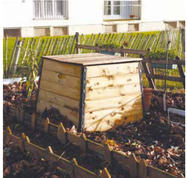
La pratique du compostage partagé se développe de plus en plus.

Dans votre immeuble, votre résidence ou votre quartier, parlez-en autour de vous pour savoir si des habitants voudraient participer; mobilisez vos voisins, c'est un des gages de réussite d'une telle opération.