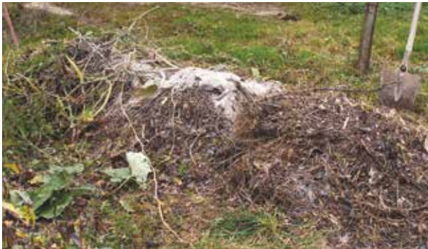
Le compostage en tas est pratique si vous disposez de place mais de peu de temps à y consacrer.