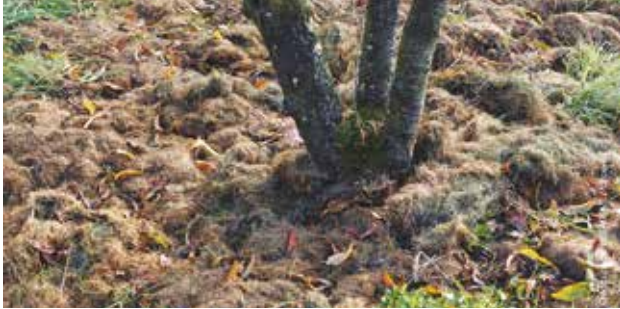
De la tonte de gazon est épanchée au pied d'un arbre.

Il exige peu de temps et vous évite les déplacements en déchèterie.