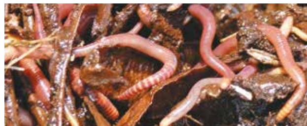
Des vers de fumier, cheville ouvrière du lombricompostage.

Attention, les lombrics provenant de la terre d'un jardin ne conviennent pas pour le lombricompostage.