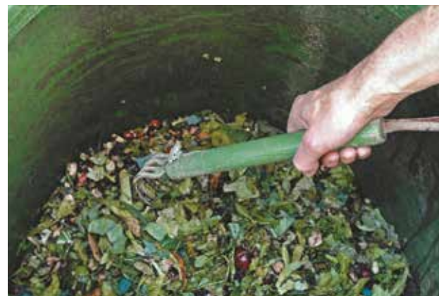
Le brassage des déchets est une des conditions de la réussite d'un compost.

réaliser un brassage régulier (notamment au début du compostage lorsque l'activité des micro-organismes est la plus forte, puis tous les 1 à 2 mois). Le brassage permet de décompacter le compost, de l'aérer et d'assurer une transformation régulière .