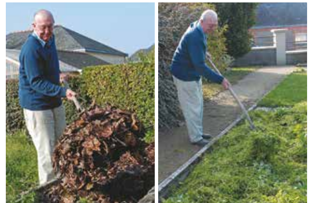
Il est possible de pailler avec des feuilles mortes ou des herbes fraîches.

des salissures, pour les fruits et légumes (paillage des fraisiers...).