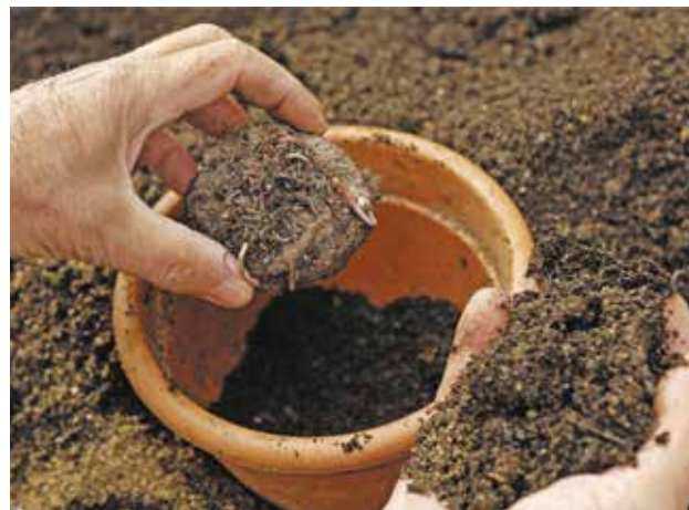
Le compost doit être mélangé avec de la terre quand il est utilisé en support de culture.

Pour la création de nouvelles jardinières, un bon mélange est constitué d' un tiers de compost, un tiers de terre et un tiers de sable . Si vous réutilisez des jardinières de l'année précédente, vous rajouterez 20 % maximum de compost à la quantité de l'ancienne terre. Vous pouvez aussi l'utiliser pour vos plantes d'intérieur de la même façon.