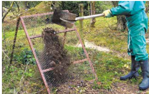
Pour tamiser, un simple grillage posé sur un cadre peut faire l'affaire.

Le tamisage permet d' affiner le compost et de l'utiliser plus facilement . Il permet d'éliminer les éléments grossiers qui n'ont pas été complètement transformés.