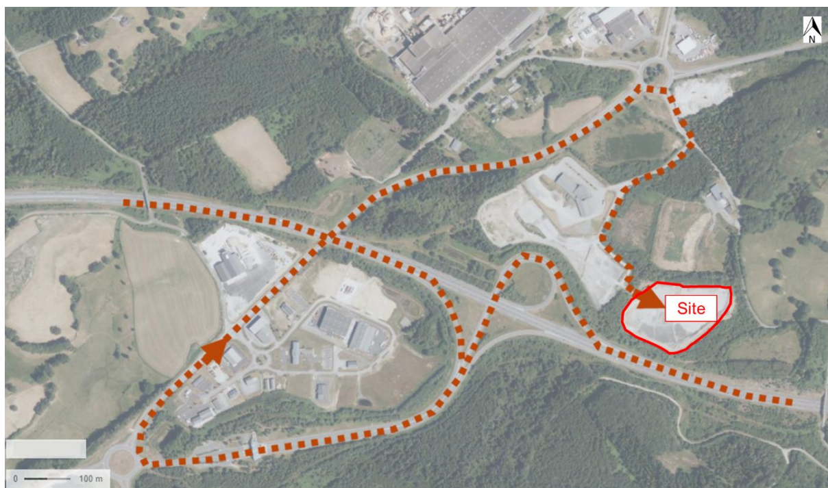
Accès au site depuis l'autoroute A89

Le site sera aménagé de la façon suivante :