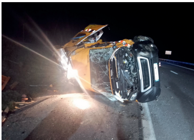
Véhicule DIRCO accidenté par un usager sur l'autoroute A20